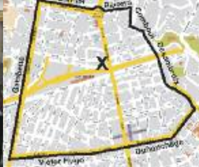
ZONE D'ACTION DU CENTRE SOCIAL